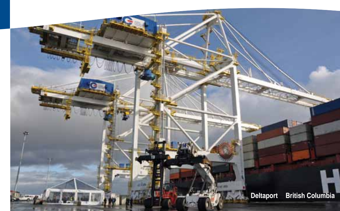
Deltaport British Columbia

H n bao gi h t, gi ãy Canada s n sàng t n d ng các l i ích có ct ho t ng th ng m i trong khu v c Châu Á Thái Bình D ng. ng l c này không th b m t i, ó chính là lý do t i sao các giai o n t i p theo c a APGCI có vai trò h t s c quan tr ng. i u ó ò h i ph i có hành ng m nh m và s h p tác h n n a t t c các c p n m b t các h i kinh t và m b o các l i th c nh tranh c a Canada.